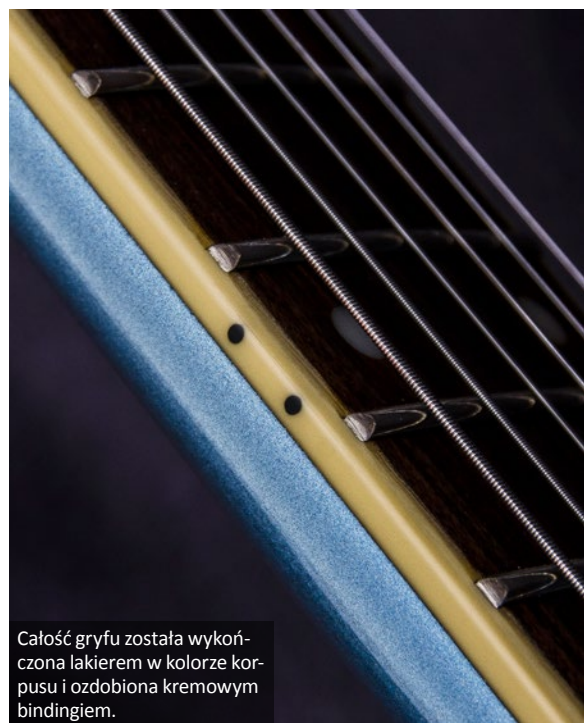
Całość gryfu została wykończona lakierem w kolorze korpusu i ozdobiona kremowym bindingiem.