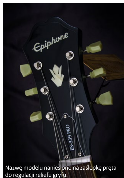
Nazwę modelu naniesiono na zaślepkę pręta do regulacji reliefu gryfu.