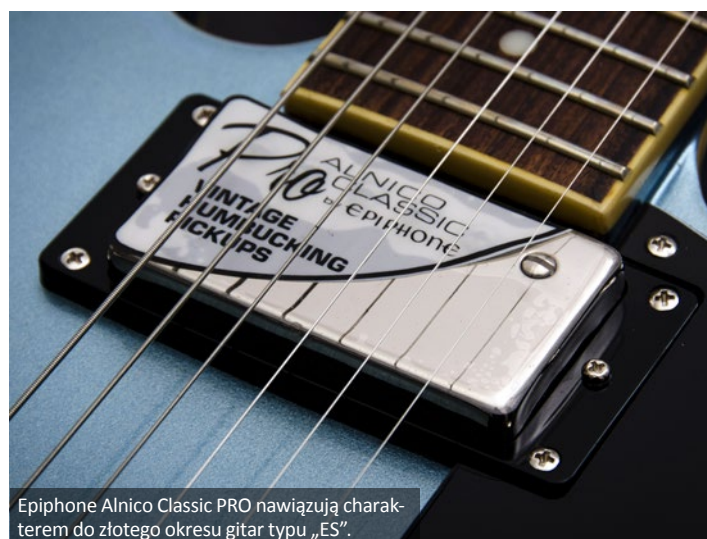
Epiphone Alnico Classic PRO nawiązują charakterem do złotego okresu gitar typu „ES”.