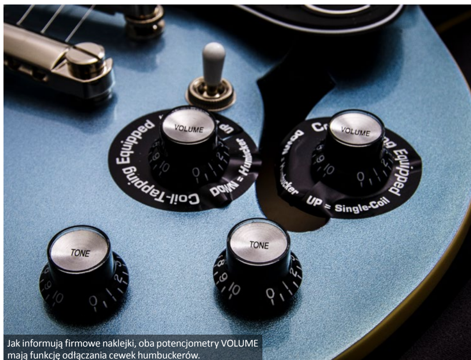
Jak informują firmowe naklejki, oba potencjometry VOLUME mają funkcję odłączania cewek humbuckerów.