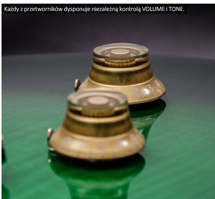
Każdy z przetworników dysponuje niezależną kontrolą VOLUME i TONE.