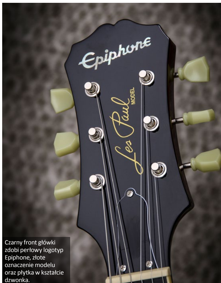
Czarny front główki zdobi perłowy logotyp Epiphone, złote oznaczenie modelu oraz płytką w kształcie dzwonka.