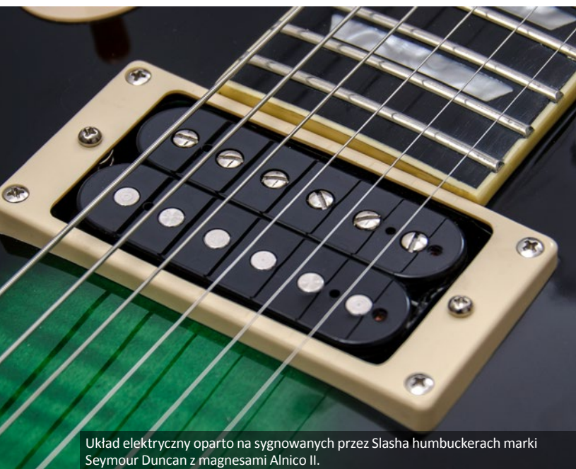
Układ elektryczny oparto na sygnowanych przez Slasha humbuckerach marki Seymour Duncan z magnesami Alnico II.