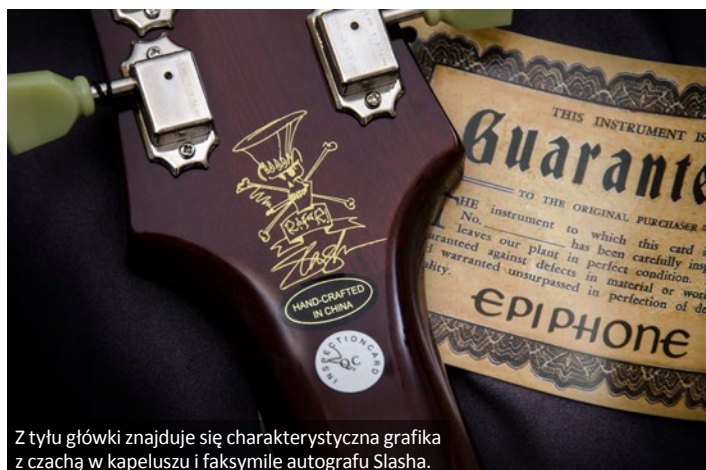
Z tyłu główki znajduje się charakterystyczna grafika z czaczą w kapeluszu i faksymile autografu Slasha.