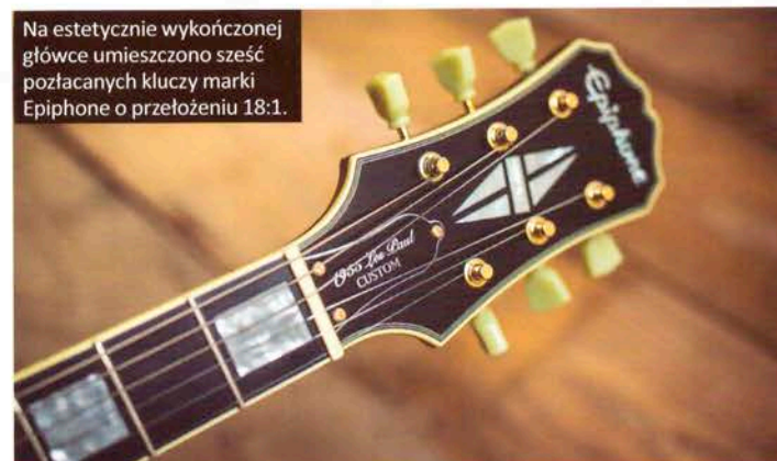
Na estetycznie wykończonej główce umieszczono sześć pozłacanych kluczy marki Epiphone o przełożeniu 18:1.

brumy. Zresztą nie jest to gitara przeznaczona do ekstremalnych przesterowań, ale za to w zakresie średnich wartości gainu z łatwością otrzymujemy soczysty, rasowy ton o dużej zawartości harmonicznym, idealny do klasycznego rocka czy bluesa. Brzmienie jest pełne, masywne i jednocześnie śpiewne, co zdecydowanie zachęca do gry. Poza tym pickupy dobrze reagują na korekty dokonywane potencjometrami VOLUME i TONE. Przy skręceniu gałki głośności i mocniejszym wystrojeniu wzmacniacza otrzymujemy zestaw pozwalający na uzyskanie szerokiego spektrum brzmień bez konieczności przełączania kanałów. Gitara najlepiej sprawdza się w parze ze wzmacniaczem lam-