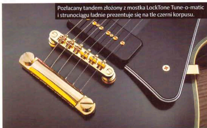
Połączony tandem złożony z mostka LockTone Tune-o-matic i strunociągu ładnie prezentuje się na tle czerni korpusu.