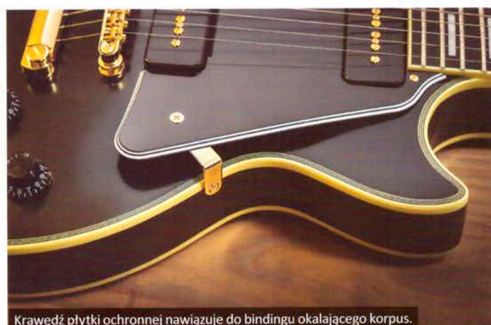
Krawędź płytki ochronnej nawiązuje do bindingu okalającego korpus.