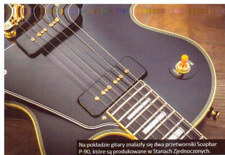
Na pokładzie gitary znalazły się dwa przetworniki Soapbar P-90, które są produkowane w Stanach Zjednoczonych.