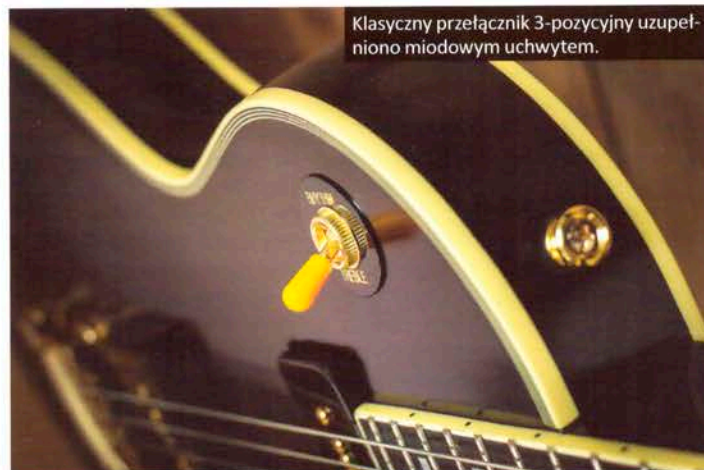
Klasyczny przełącznik 3-pozycyjny uzupełniono miodowym uchwytem.