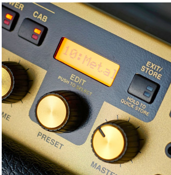
Wyświetlacz z gałką PRESET działającą w trybie push pozwala na edycję parametrów oraz zmianę zapisanych programów.