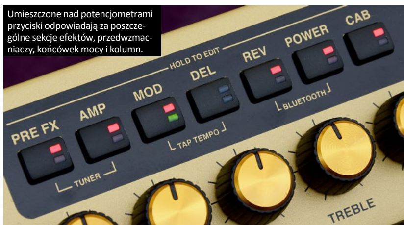
Umieszczone nad potencjometrami przyciski odpowiadają za poszczególne sekcje efektów, przedwzmacniaczy, końcówek mocy i kolumn.