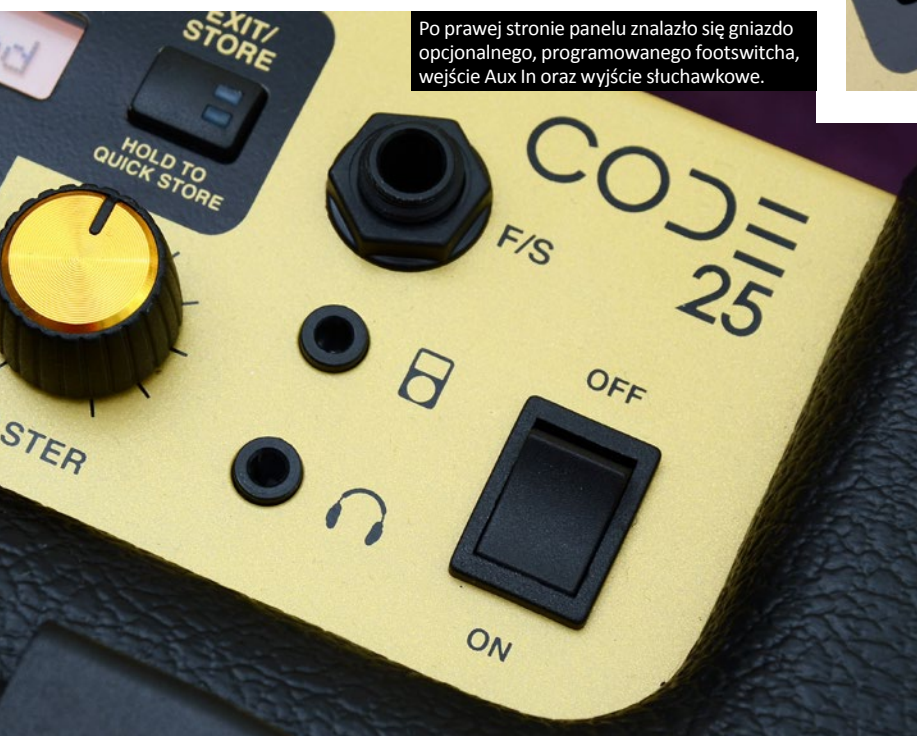
Po prawej stronie panelu znalazło się gniazdo opcjonalnego, programowanego footswitcza, wejście Aux In oraz wyjście słuchawkowe.