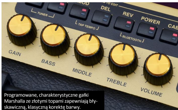
Programowane, charakterystyczne gałki Marshalla ze złotymi topami zapewniają błyskawiczną, klasyczną korektę barwy.