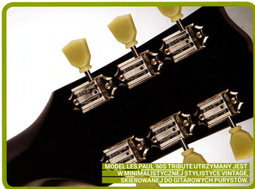
MODEL LES PAUL '60S TRIBUTE UTRZYMANY JEST W MINIMALISTYCZNEJ STYLISTYCE VINTAGE, SKIEROWANEJ DO GITAROWYCH PURYSTÓW.

między typowymi singlami i humbuckermi – konstrukcyjnie są to przetworniki jednocewkowe, ale ich rozmiar i grubość zwojów dają dźwięk pełniejszy, bardziej mięsisty niż standardowe, stratocasterowe single, zbliżony bardziej do humbuckerów.