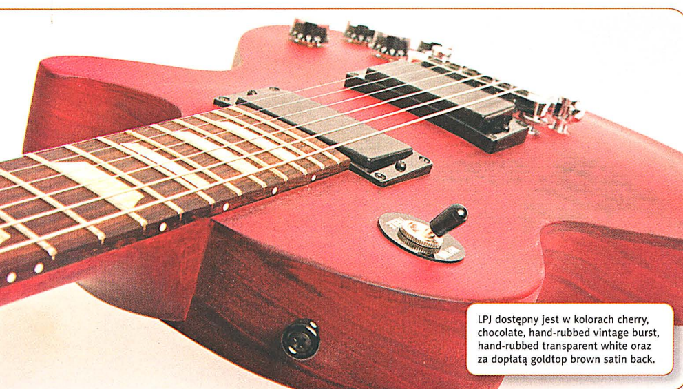
LPJ dostępny jest w kolorach cherry, chocolate, hand-rubbed vintage burst, hand-rubbed transparent white oraz za dopłatą goldtop brown satin back.

Struny opierają się na siodełku z materiału corian, płytko naciętym. Gibson od pewnego czasu z powodzeniem stosuje to rozwiązanie zapobiegające zakleszczaniu się struny w rowku i utrudnianiu poprawnego strojenia. W instrumencie zamontowano dobry strunociąg i mostek typu Tune-O-Matic oraz stroiki Vintage