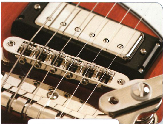
Dzięki strunociągowi Tremotone gitara ta bardzo medialna i fotogeniczna.

Instrument testowałem na wspaniałym zestawie Mesa Transatlantic 30 wraz z dedykowaną paczką i nie mogło to zabrzmieć słabo, choć i na malutkim Laneyu Cub 10 wiośło odzywało się bardzo porządnie. Na początek brzmienia czyste. Prawdziwa magia dźwięku ujawnia się tutaj, gdy pobawimy się przelącznikiem pracy przetworników. Można zamknąć oczy i przenieść się na chwilę w świat muzyki, która nie przypomina na szczęście polskich eliminacji do festiwalu Eurowizja 2011... W pozycji gryfowej jest to sound o jazzowo-bluesowym zabarwieniu, miękki i głęboki, ale też wystarczająco selektywny. Faktycznie na strunach basowych przypomina nieco fenderowską szklanę, którą miał niegdyś gonić, lecz struny wiolinowe to już bardziej dźwięczny środek niemal z Gibsona SG. Szczególnie przy solówkach, ujawniają się też twangowe inklinacje Wilshire'a - śmiało można na tym wiośle grać covery