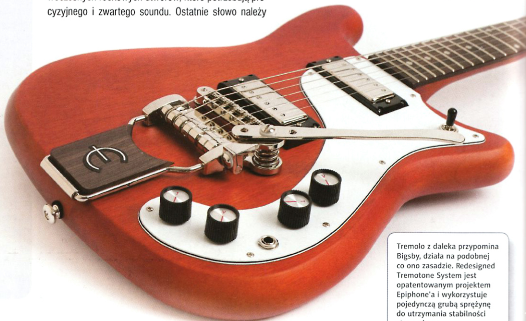
Tremolo z daleka przypomina Bigsby, działa na podobnej co ono zasadzie. Redesigned Tremotone System jest opatentowanym projektem Epiphone'a i wykorzystuje pojedynczą grubą sprężynę do utrzymania stabilności strunociągu.

Stylistyka i niezwykle klimat instrumentu w połączeniu z wygodą gry i niską ceną sprawiają, że jest to świetna okazja dla muzyków poszukujących niebanalnych instrumentów. Dzięki strunociągowi Tremotone gitara ta jest również bardzo medialna i fotogeniczna, a więc spełnia większość wymagań, jakie możemy mieć wobec takiego instrumentu.